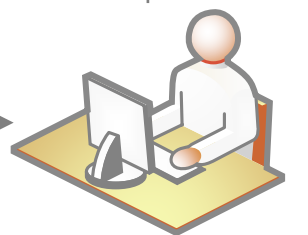
Cơ quan Hải Quan